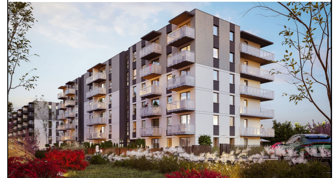
POŁOŻENIE MIESZKANIA W BUDYNKU